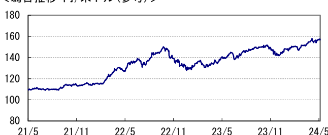
＜為替推移 円/米ドル(参考)＞

※当レポート中の各数値は四捨五入して表示している場合がありますので、それを用いて計算すると誤差が生じることがあります。