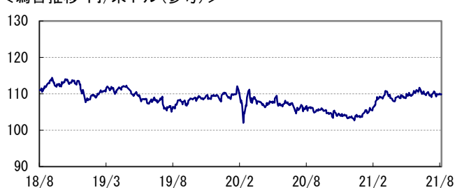
<為替推移 円/米ドル(参考)>

※当レポート中の各数値は四捨五入して表示している場合がありますので、それを用いて計算すると誤差が生じることがあります。