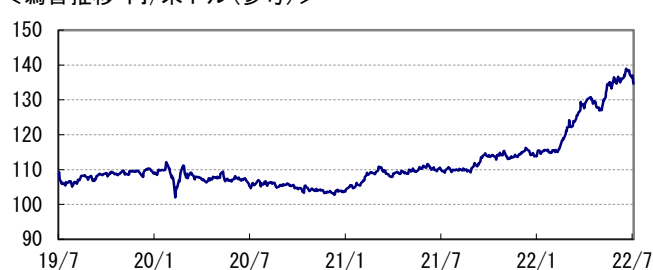
<為替推移 円/米ドル(参考)>

※当レポート中の各数値は四捨五入して表示している場合がありますので、それを用いて計算すると誤差が生じることがあります。