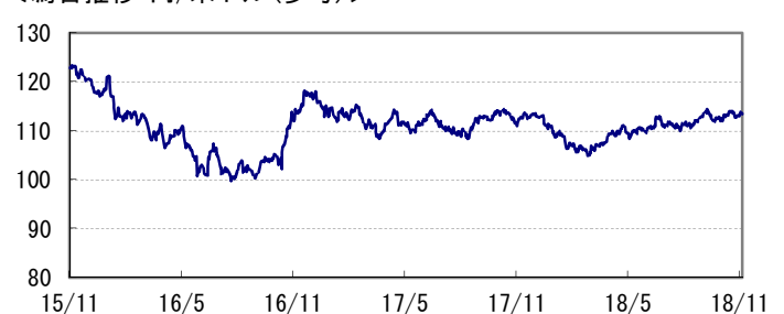
<為替推移 円/米ドル(参考)>

※当レポート中の各数値は四捨五入して表示している場合がありますので、それを用いて計算すると誤差が生じることがあります。