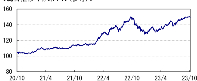
<為替推移 円/米ドル(参考)>

※当レポート中の各数値は四捨五入して表示している場合がありますので、それを用いて計算すると誤差が生じることがあります。